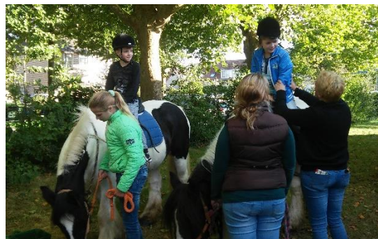
Fancy Fair – 5 oktober 2016